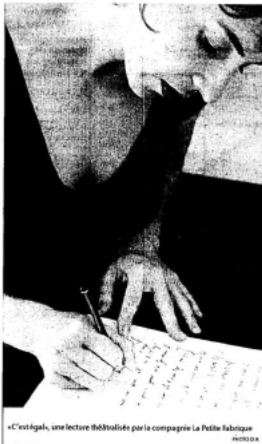
« C'est égal », une lecture théâtralisée par la compagnie La Petite Fabrique

Créations locales. Le reste compose une image flatteuse de la création girondine de l'année écoulée. « Aliénor exagère », du Groupe Anamorphose constitue une joyeuse entame pour un dimanche. Tandem débute en effet par la présentation du travail d'un atelier amateur animé par Renaud Cojo suivie de la loufo-